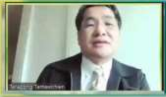
ศ. U.W. อึ้ง-พงษ์ ศัลยแพทย์

World Health Organization. Influenza. Which vaccine formulation to use – Northern or Southern Hemisphere? Retrieved from https://www.who.int/news-room/fact-sheets/detail/influenza-vaccines . Accessed on 22 Nov 21.